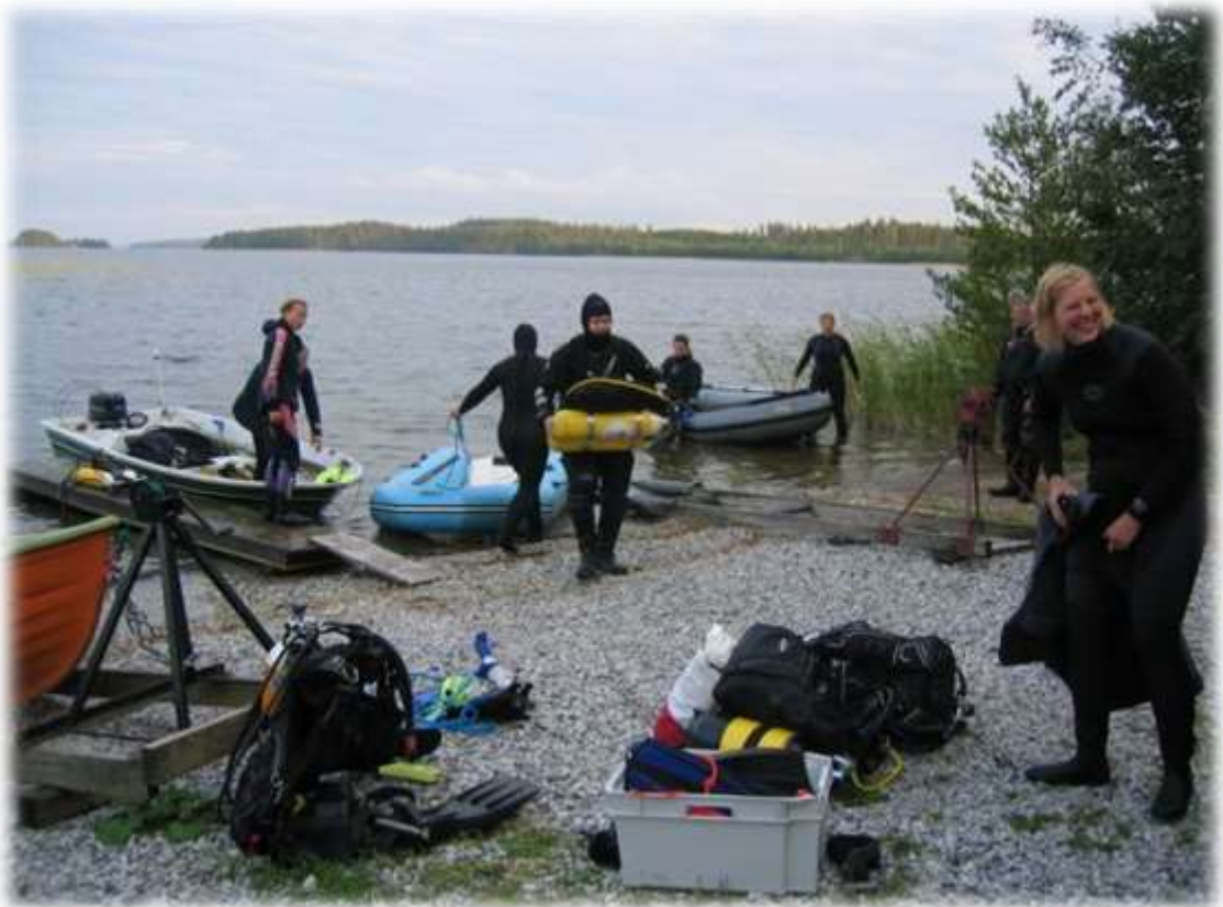
Viikkosukellus Puruveden Linnasaareen vuonna 2005.

Seuralla on ollut vakiintunut käytäntö järjestää kesäaikaan viikkosukelluksia. Viikkosukellukset ovat suuntautuneet useimmin seuran tukikohtaan Valkiajärvelle. Viikkosukelluksia on järjestetty jonkin verran myös kirkasvetisille lammille, Punkaharjun proomuille, Puruvedelle ja Pyhäjärvelle. Seuran jäsenet ovat osallistuneet useina vuosina myös Puruveden Retkeilyn ja Aurinkokunnan kuvantekijöiden toteuttaman vedenalaisen taidenäyttelyn upotukseen.