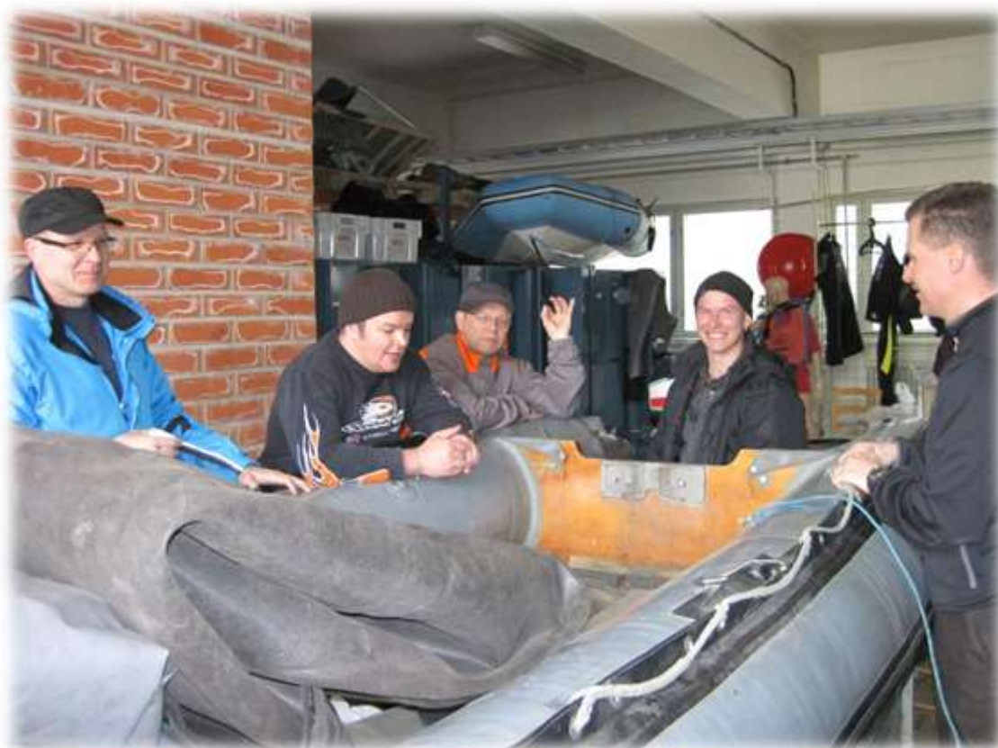
Talkoot ovat tärkeä osa yhdistystoimintaa. Kuva Lupin siivoustalkoista vuodelta 2012.