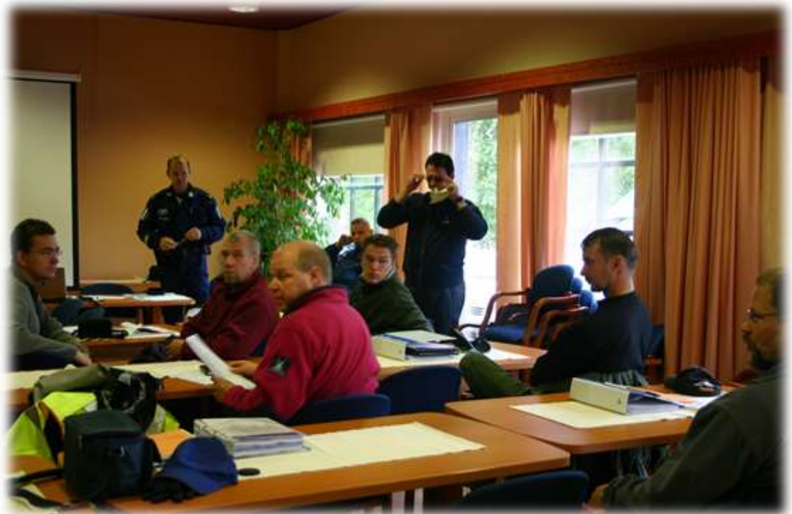
Sukeltajaliitto järjesti syksyllä 2006 valtakunnallisen Vapepa-sukeltajakurssin Kesälahdella. Kurssille osallistui kurssilaisia ja avustajia myös seurastamme.