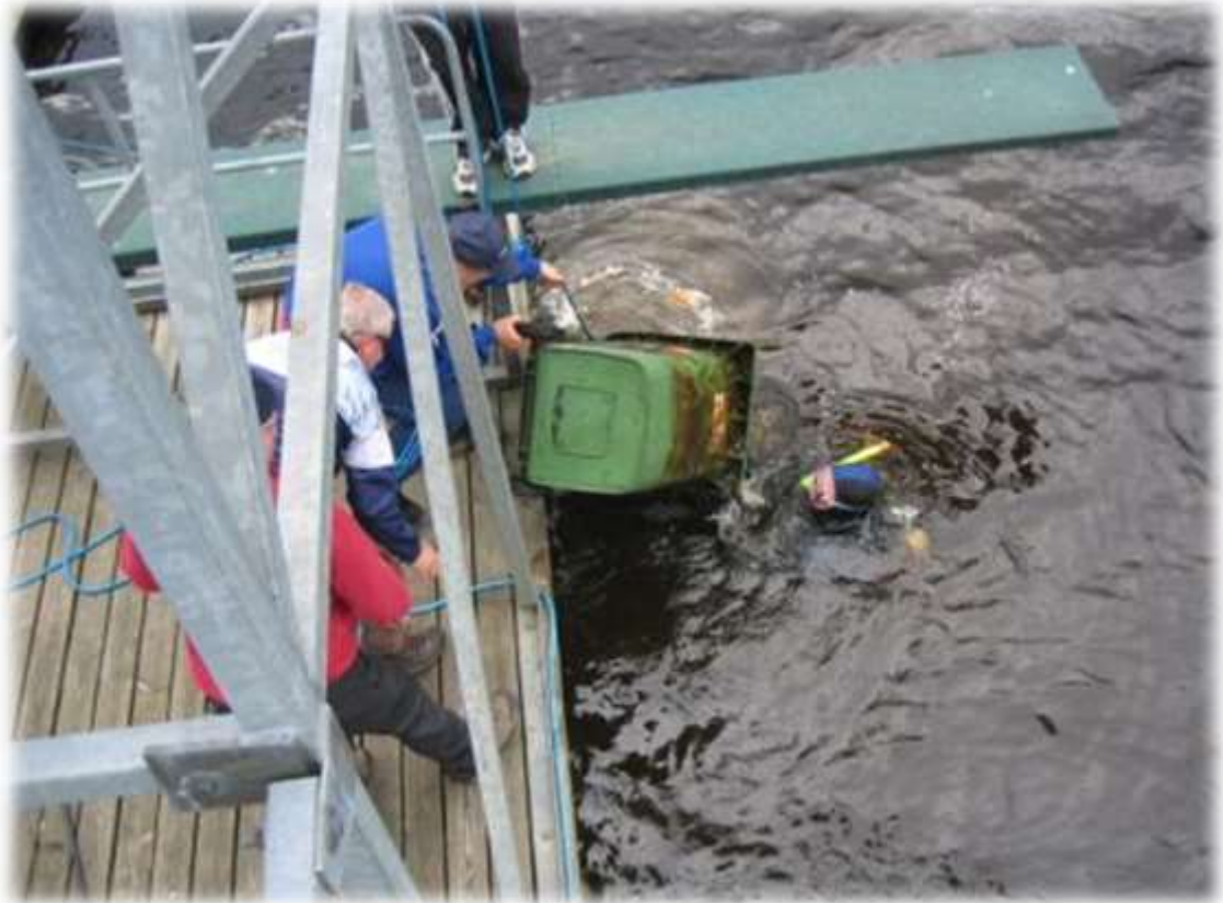
Postinrannan tarkastukset ovat kuuluneet seuran jokavuotisiin tapahtumiin.

jäsenen erottamisesta aiheutuneet oikeudenkäyntikulut. Nykyisellään seuran talous on vakaalla ja turvallisella pohjalla.