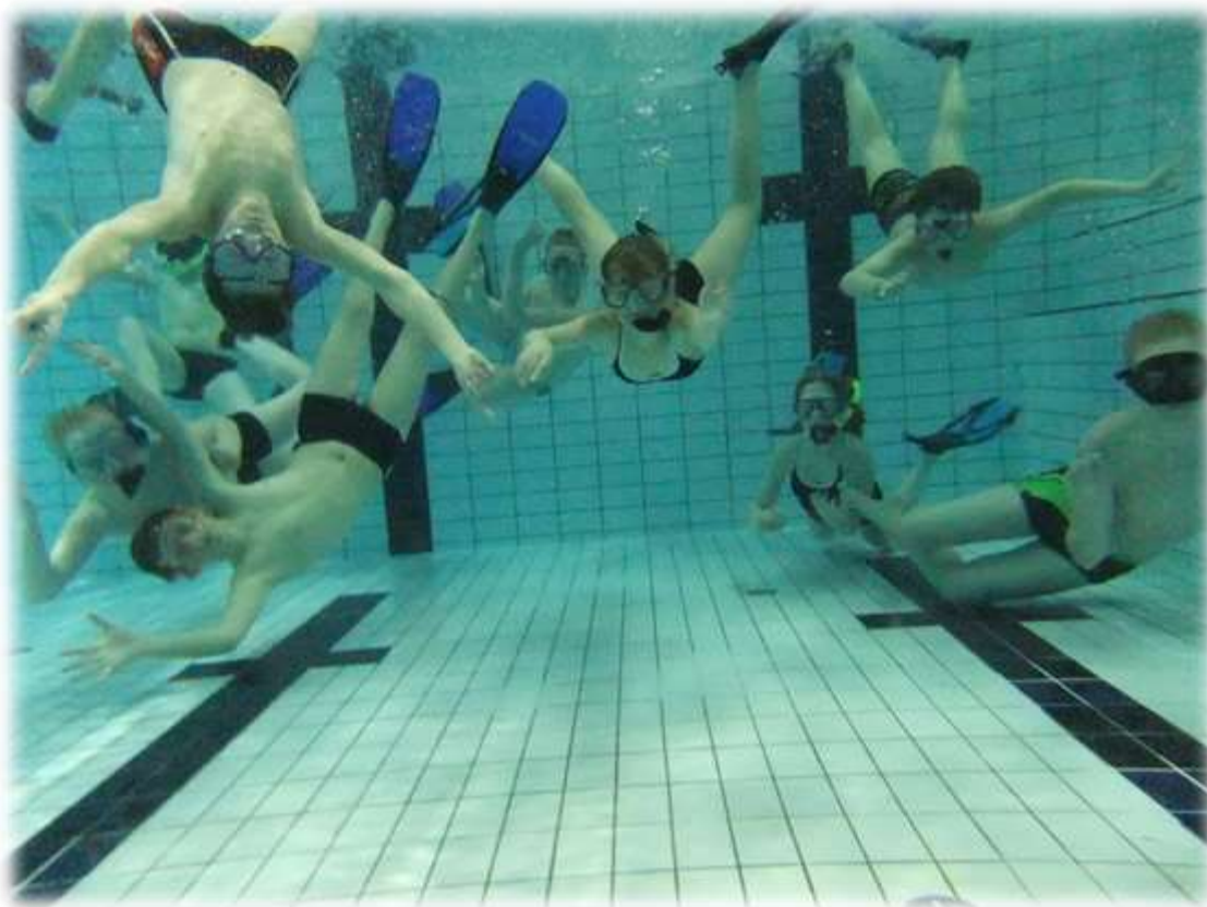
Norppatoiminta aktivoitui 2009.