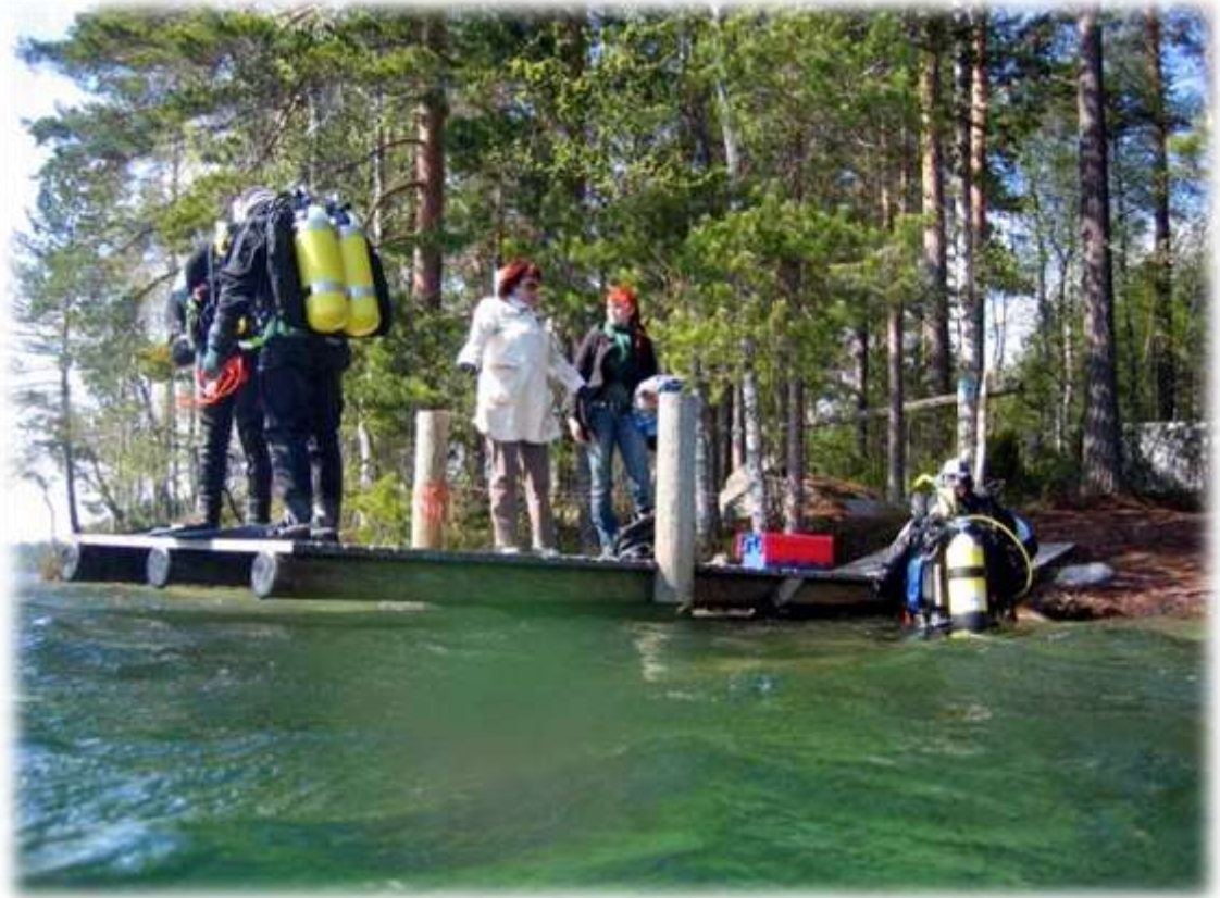
Valkiajärven tukikohta on ihanteellinen paikka koulutustoiminnalle. Kuva vuoden 2007 peruskurssin avovesiosuudesta.